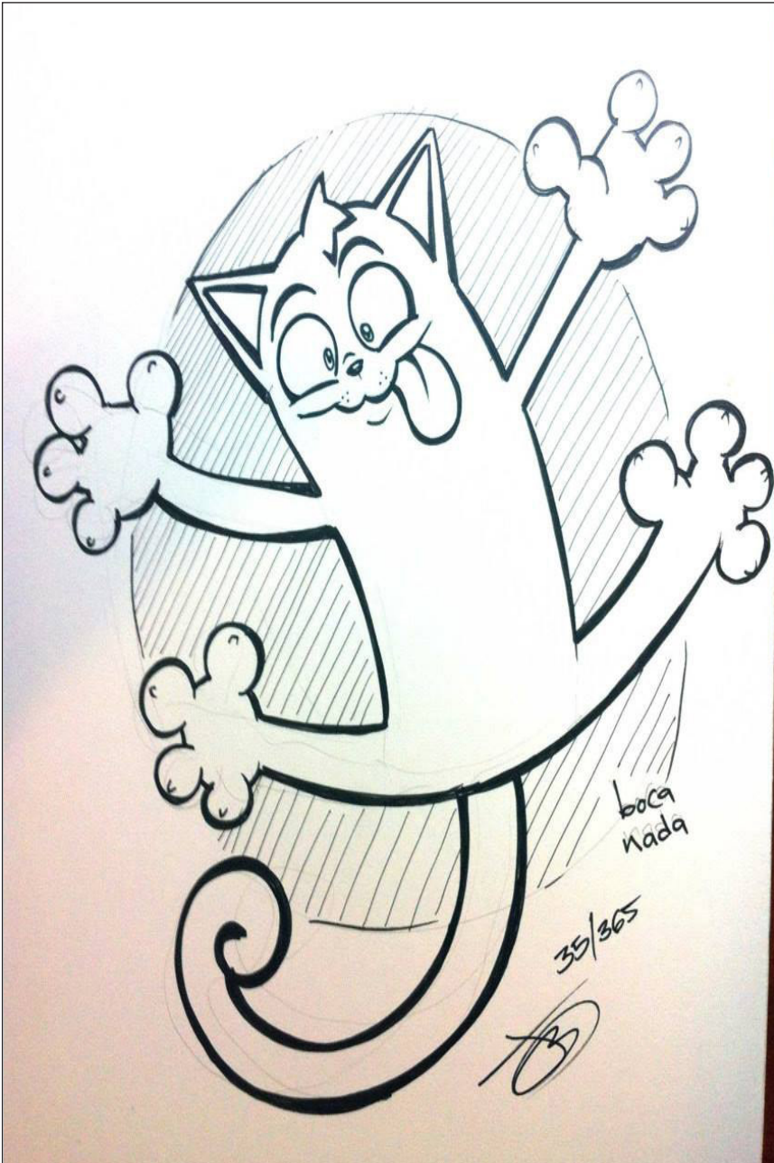
Gato en puerta