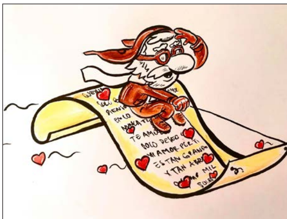
Viajes en pandemia 6 | Grafito, acuarela y retoque digital | 2020