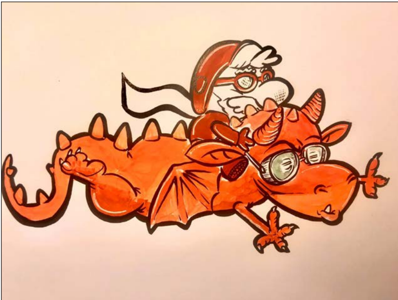
Viajes en pandemia 14 | Grafito, acuarela y retoque digital | 2020