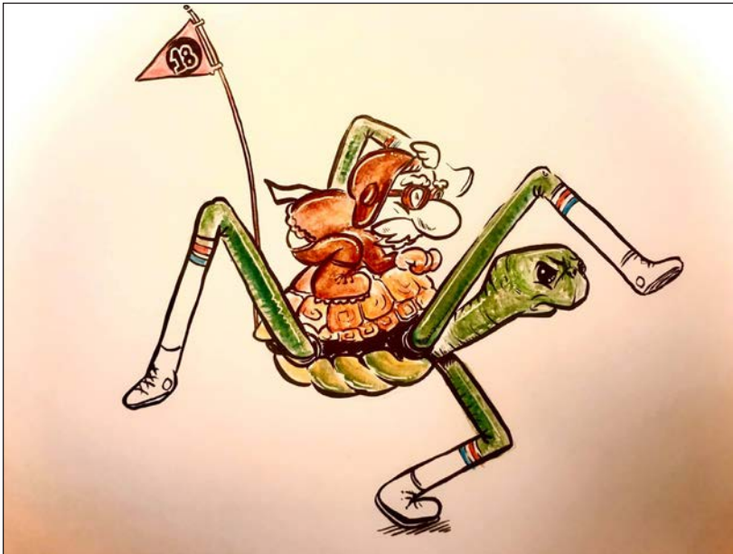
Viajes en pandemia 9 | Grafito, acuarela y retoque digital | 2020