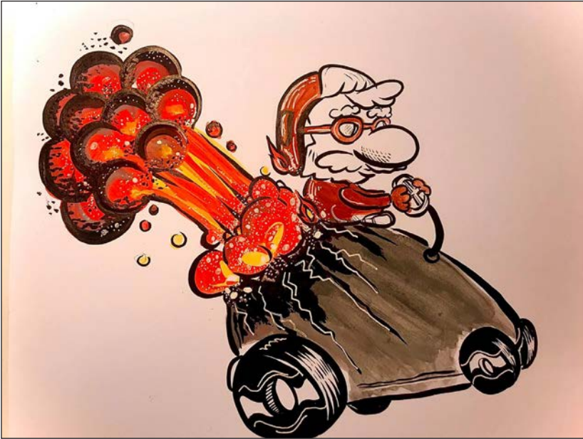
Viajes en pandemia 15 | Grito, acuarela y retoque digital | 2020