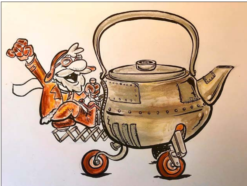
Viajes en pandemia 2 | Grafito, acuarela y retoque digital | 2020