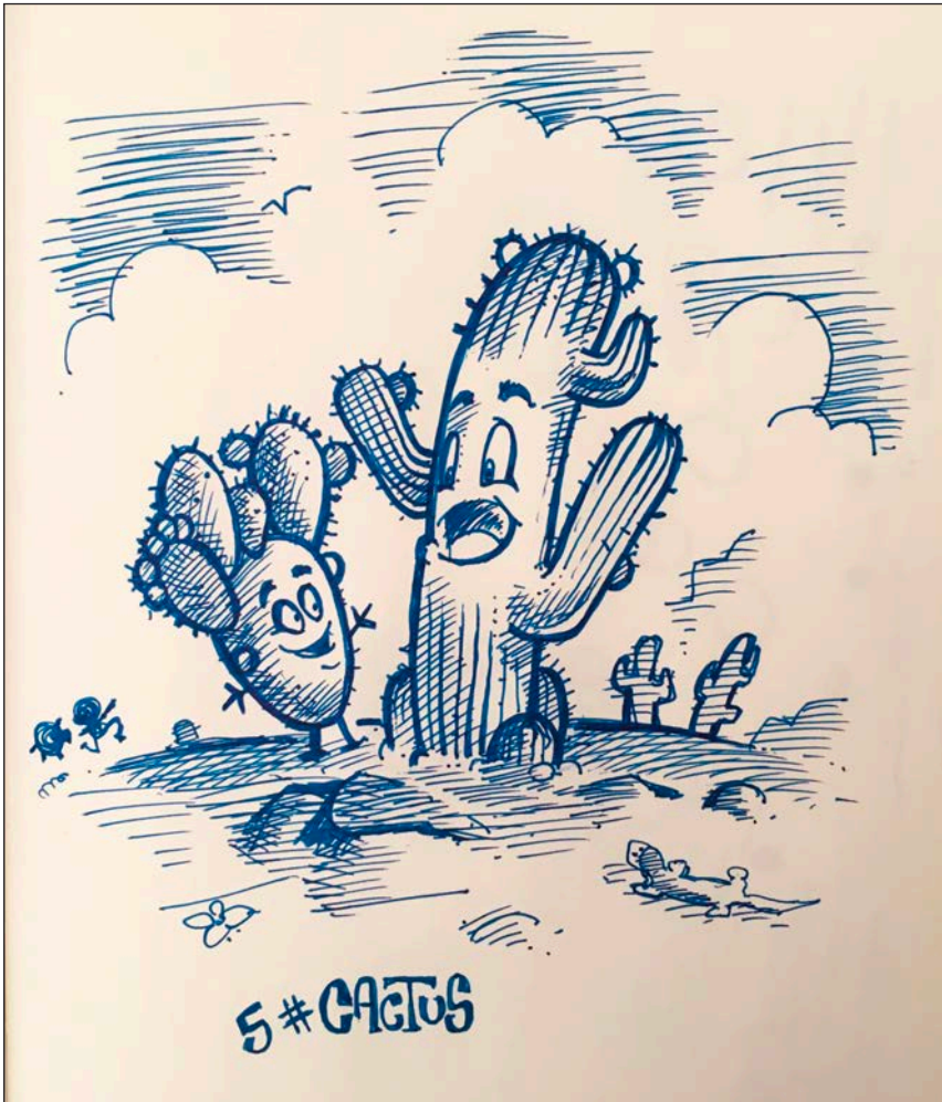
Viaje al interior | Grafito, acuarela y retoque digital | 2020