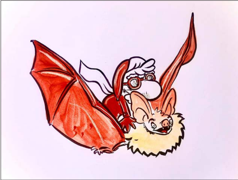
Viajes en pandemia 13 | Grafito, acuarela y retoque digital | 2020