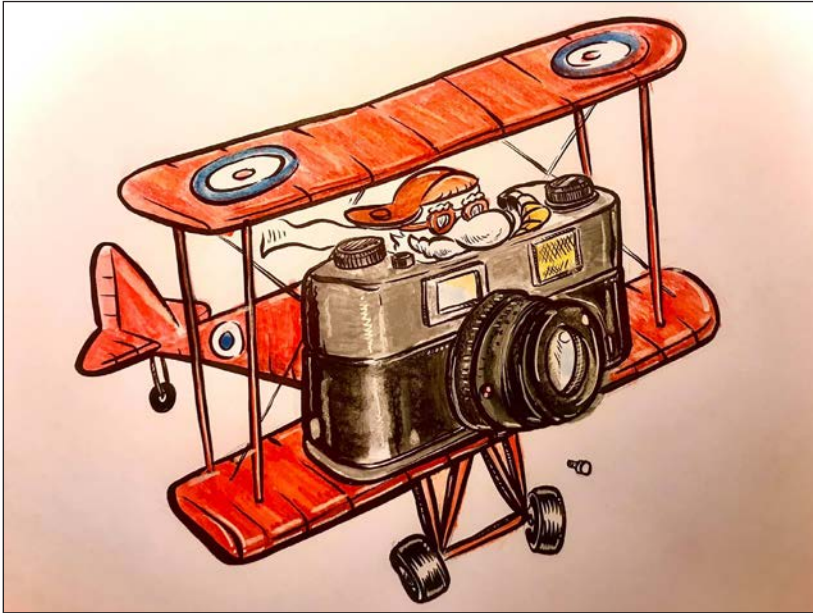
Viajes en pandemia 7 | Grafito, acuarela y retoque digital | 2020