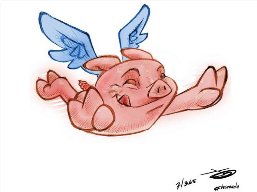
Vuelo libre | Grito y retoque digital | 2012