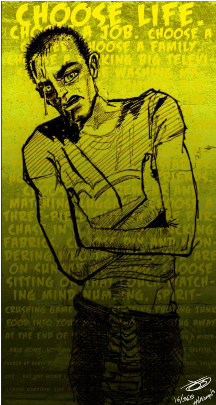
Choose Life | Grafito y retoque digital | 2012