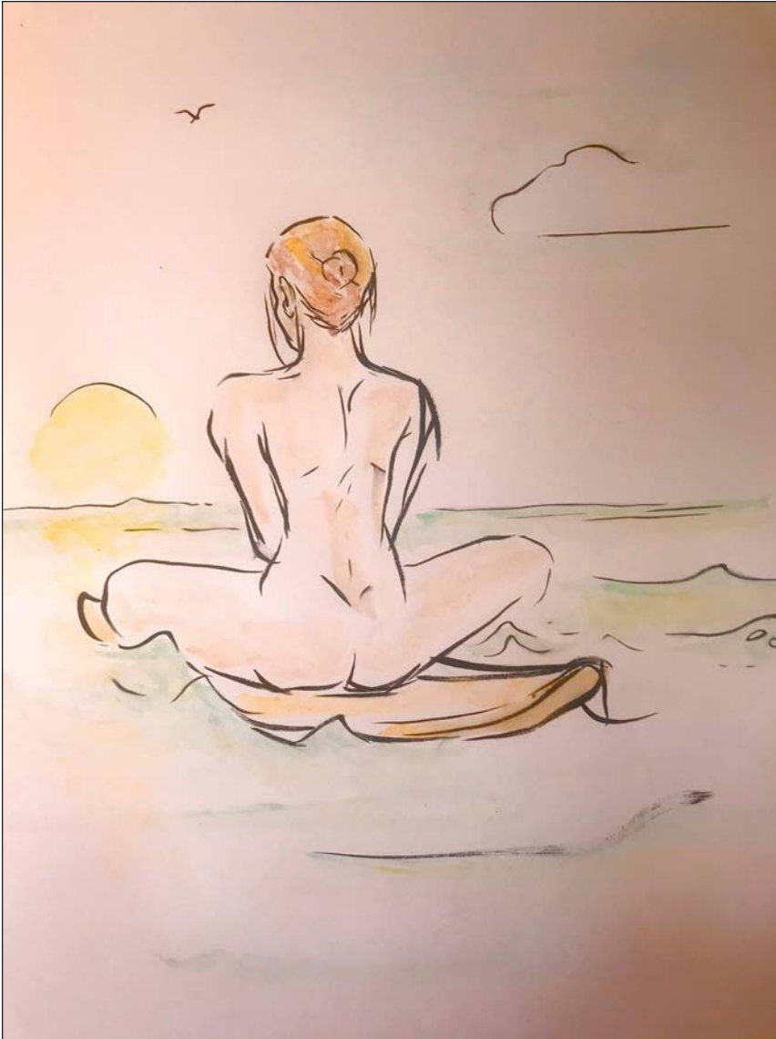
Atardecer | Grafito y acuarela | 2012