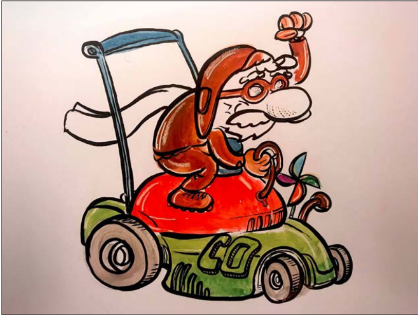
Viajes en pandemia 11 | Grafito, acuarela y retoque digital | 2020