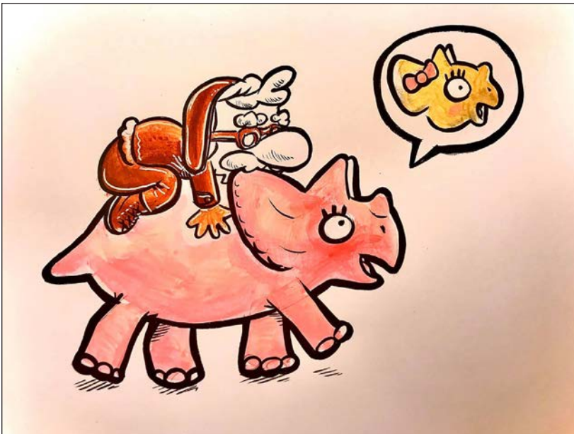
Viajes en pandemia 10 | Grafito, acuarela y retoque digital | 2020