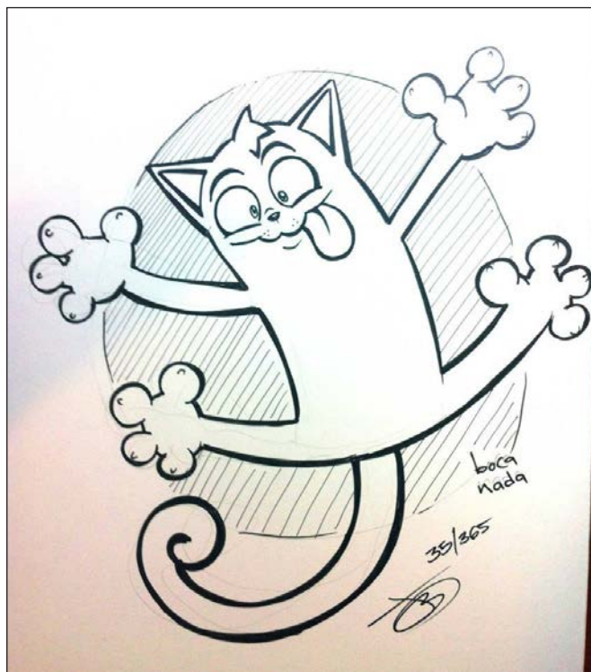
Gato en puerta | Grafito y tinta china | 2012