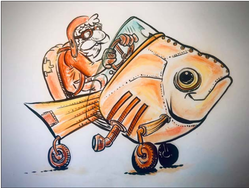
Viajes en pandemia 1 | Grafito, acuarela y retoque digital | 2020