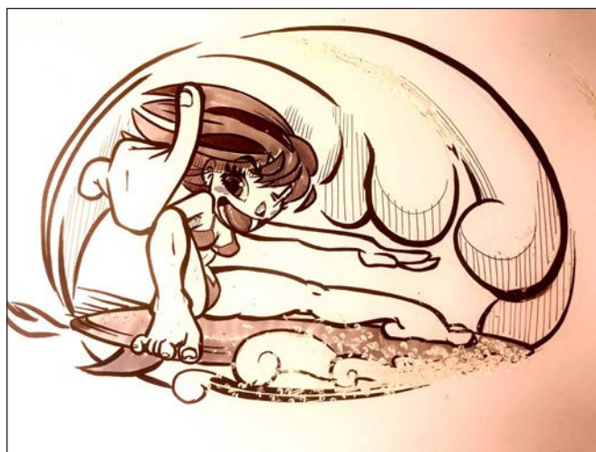
Tubo. Grafito | tinta y retoque digital | 2012