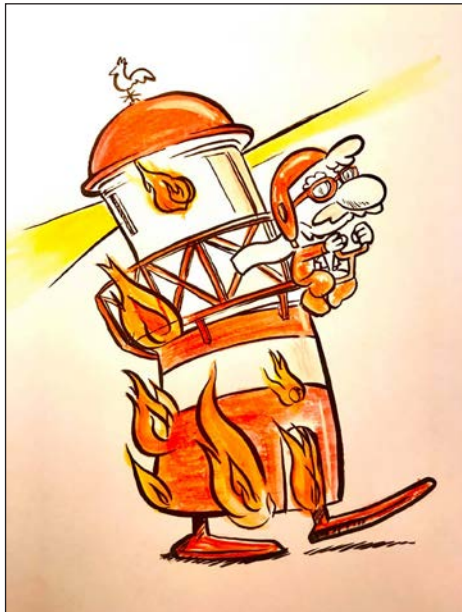
Viajes en pandemia 4 | Grafito, acuarela y retoque digital | 2020