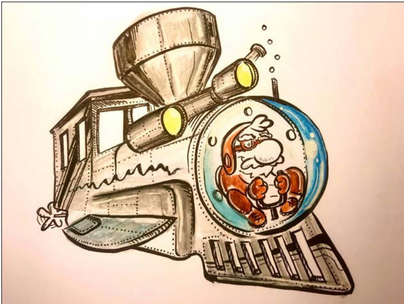
Viajes en pandemia 8 | Grafito, acuarela y retoque digital | 2020