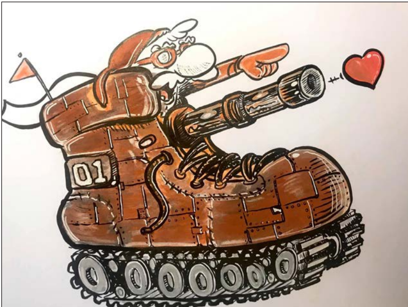
Viajes en pandemia 12 | Grafito, acuarela y retoque digital | 2020