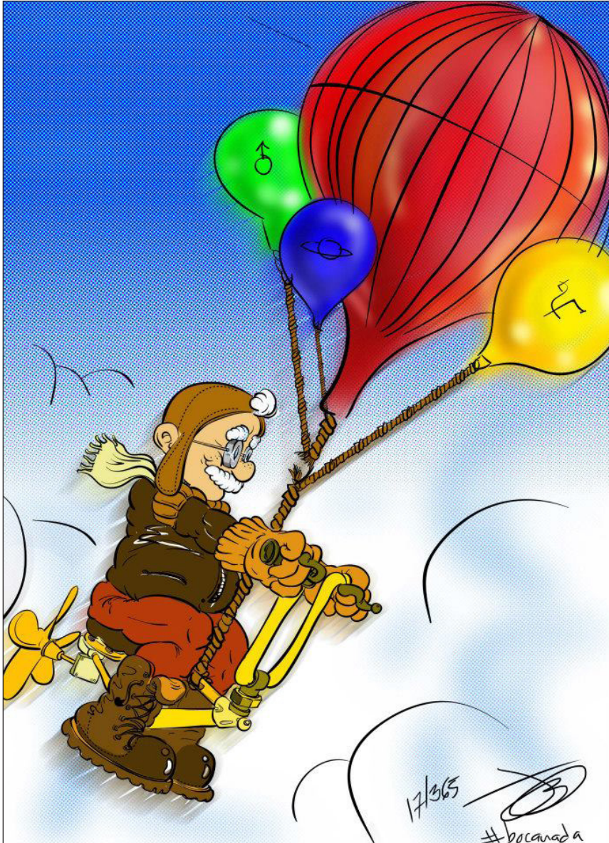
Viaje en globo | Grafito y retoque digital | 2012