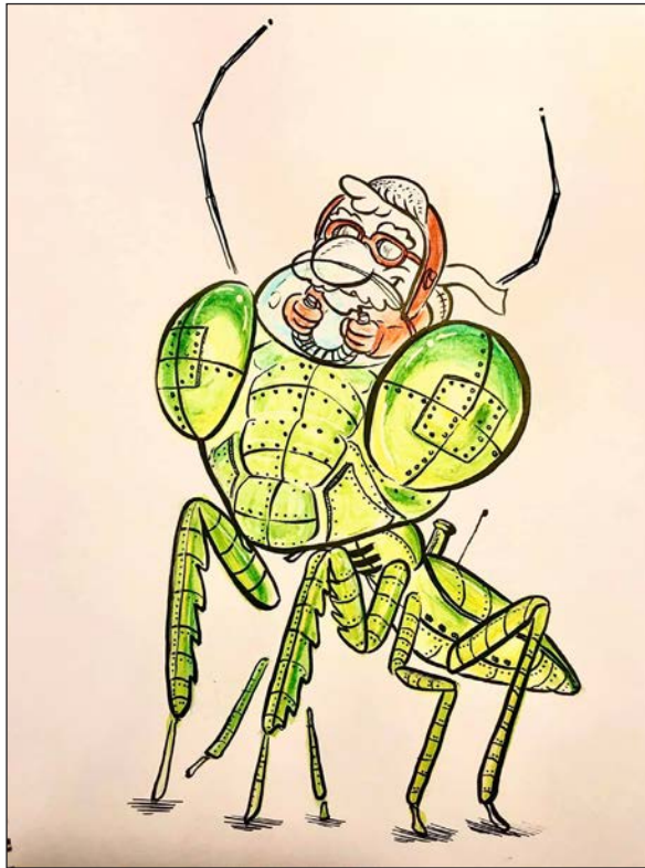
Viajes en pandemia 5 | Grafito, acuarela y retoque digital | 2020