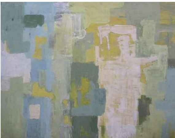
Título: Abstracto 2