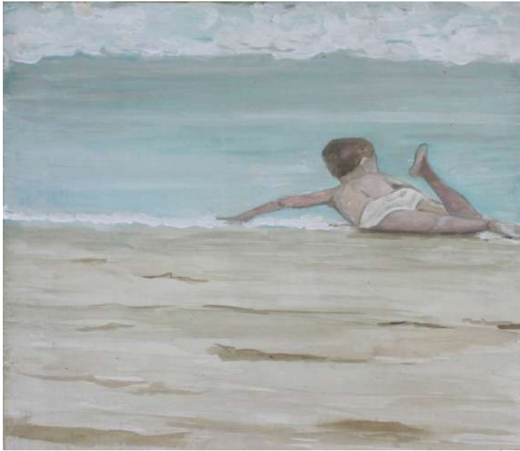
Título: Niño 1