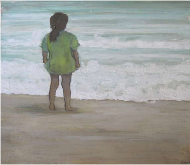
Título: Niña 1