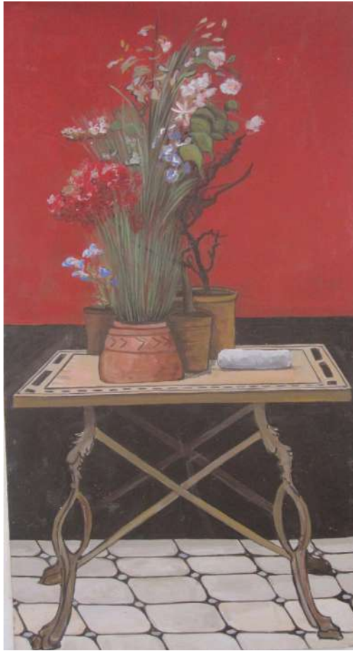
Título: Flores 2