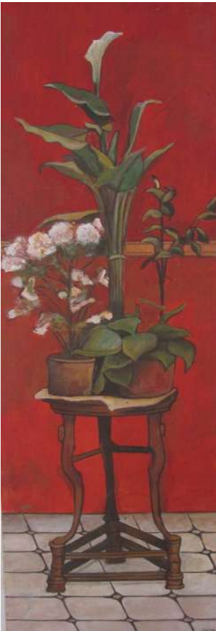
Título: Flores 1