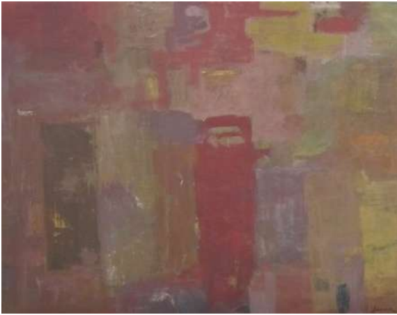
Título: Abstracto 1