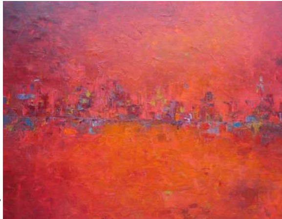
Título: Abstracto skyline