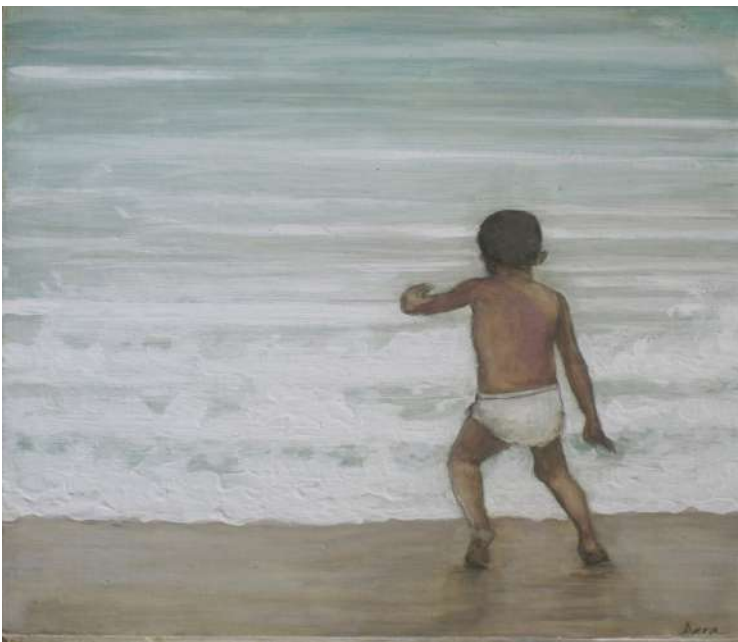
Título: Niño 2