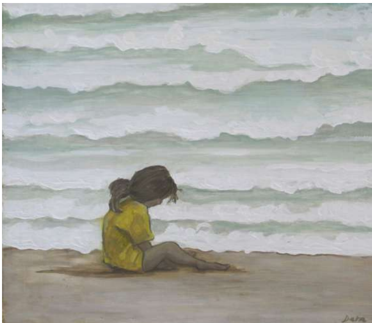
Título: Niña 2